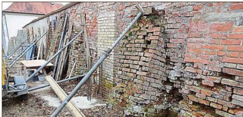
So sah es während der Sanierung aus.

Für die mit rund 600 000 Euro zu Buche schlagende Sanierung der Irseer Klostermauer wurden 86 000 Euro Fördergelder seitens der Bayerischen Landesstiftung, des Bayerischen Landesamts für Denkmalpflege, des Landkreises Ostallgäu und der Marktgemeinde Irsee zugesagt. > BSZ